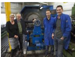
De Dekens Groep was in 2014 finalist van de Groninger Ondernemers Prijs.

TEKST: YOLANDA WALIS FOTO'S: YOLANDA WALIS