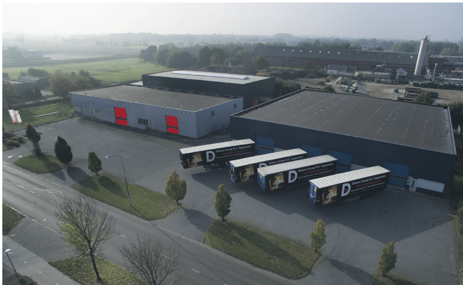
Deze extra productiehal bij Machinefabriek Dekens van 1.000 vierkante meter is inmiddels af. Momenteel wordt nog gewerkt aan de kantoren.